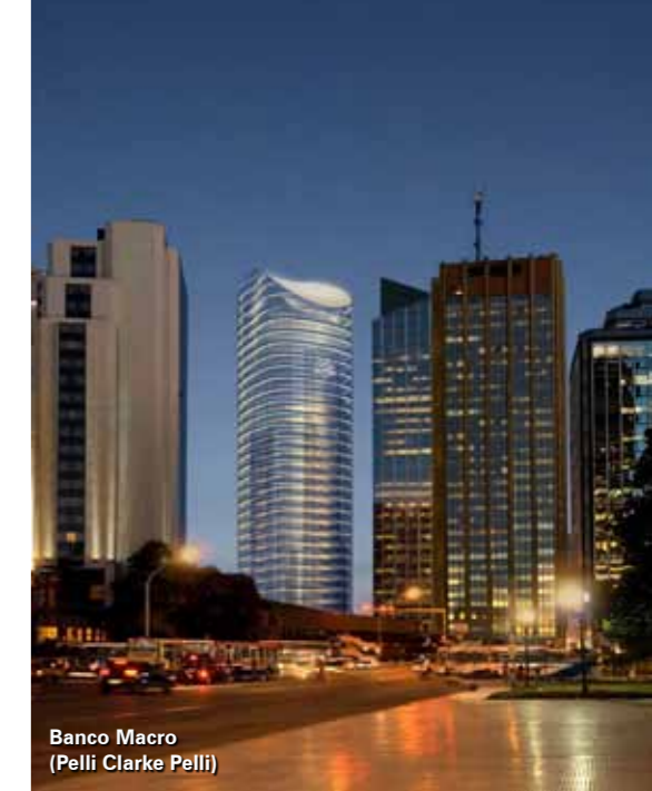
Banco Macro (Pelli Clarke Pelli)

A cargo de: Axel Zemborain y Gonzalo Suarez Aboy (Estudio Pelli-Clarke-Pelli architects + GSA Arquitectos) El ejercicio de diseño se centra en la inserción de edificios de alta densidad en el tejido consolidado de una manzana típica de la ciudad de Buenos Aires, sobre dos localizaciones posibles. El objetivo es la comprensión de las condicionantes programáticas y urbanísticas para la inserción de edificios de envergadura en el tejido urbano, con el objetivo de controlar el impacto sobre el entorno inmediato y mediato.