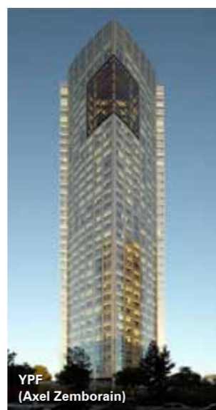
YPF (Axel Zemborain)