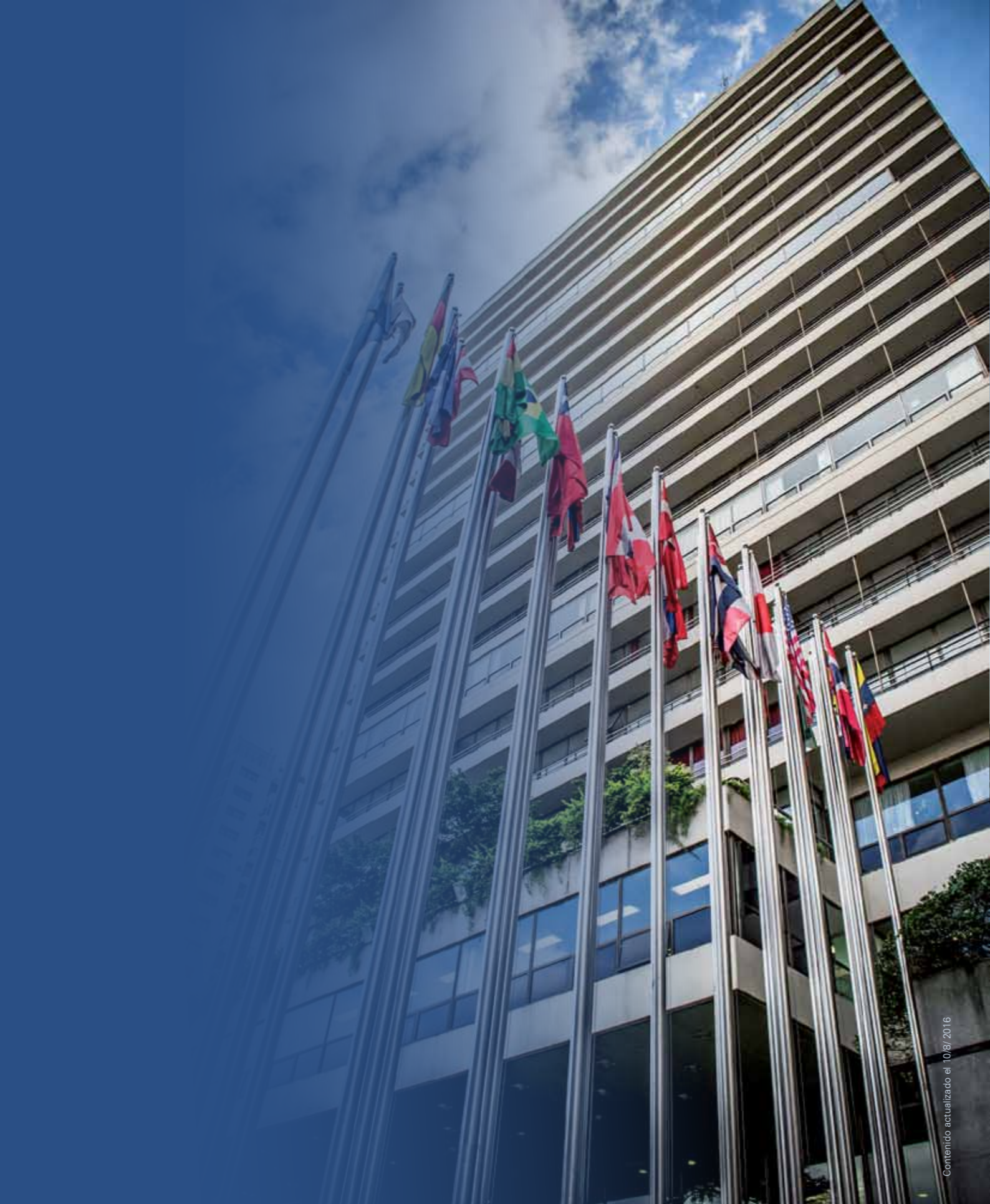
Contenido actualizado al 10/08/2016