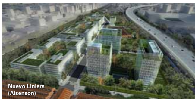
Nuevo Liniers (Aisenson)