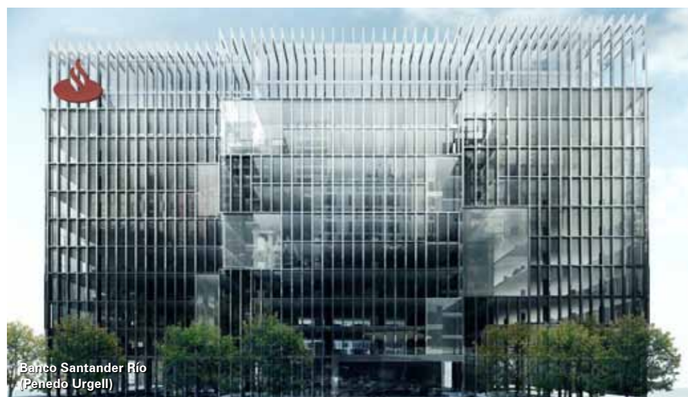
Banco Santander Río (Penedo Urgell)