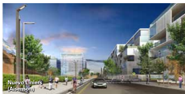
Nuevo Liniers (Aisenson)